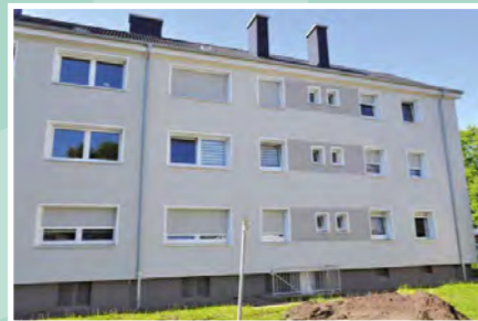
▼ Teutonenstraße 18-24