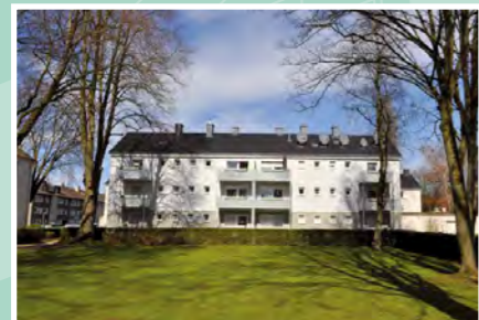
▲ Teutonenstraße 17-19